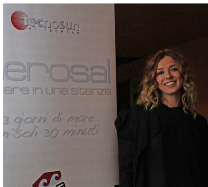
L'attrice Myriam Catania