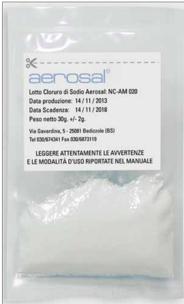
Fig. 4. Bustina di sale preconfezionata e sigillata.